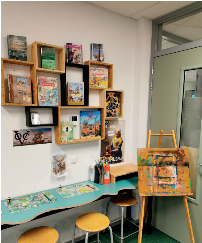
Themahoek Gouden Eeuw bovenbouw