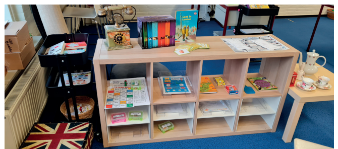
Themahoek Engeland bovenbouw