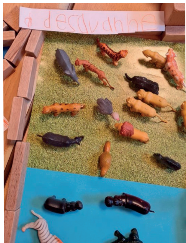
Thema 'De dierentuin'.

Ook voor oudere kinderen speelt de rijke leeromgeving een grote rol en blijven hoeken een waardevolle toevoeging in de klas. De focus ligt nu minder op het spel, maar meer op onderzoek. Thema's gekoppeld aan wereldoriëntatie of burgerschap vormen een mooi uitgangspunt om de boeken in te duiken. Een ontdekhoeck, een themamuur of schrijfhoek, uiteraard met een passend aanbod aan boeken en teksten, bieden kinderen de mogelijkheid om aan de slag te gaan