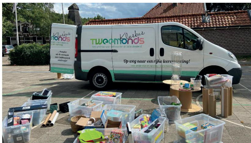
Themabrief geschreven door Lara van Oel